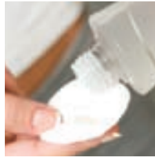
STAP 1 / Etape 1

Utilisez l'Aloe Refreshing Toner chaque matin et soir après avoir nettoyé votre peau avec le Sonya Aloe Purifying Cleanser.