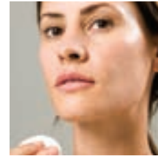
STAP 3 / Etape 3

Appliquez le Toner sur le visage, le cou, et toute autre surface si nécessaire.